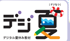
デジタル夏休み教材