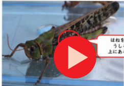
はねを持ち上げると、 うしろ足のつけ根の 上にあるのが見えるよ!