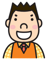
参加者 B 先生