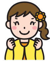
参加者 D 先生

授業の実際や授業者の働きかけについて、子どもたちの言葉や姿をとおして伝えていただいたので、深く納得できたし、自分もがんばりたいと意欲がさらに高まりました。教材の生かし方について詳しく解説いただけるのは、「光文セミナーならでは」だなとも感じ、ありがたいです。