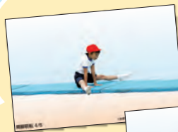
「掲示用写真素材集」より