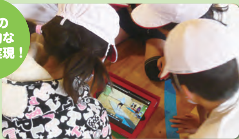
「つまずき解決法」より