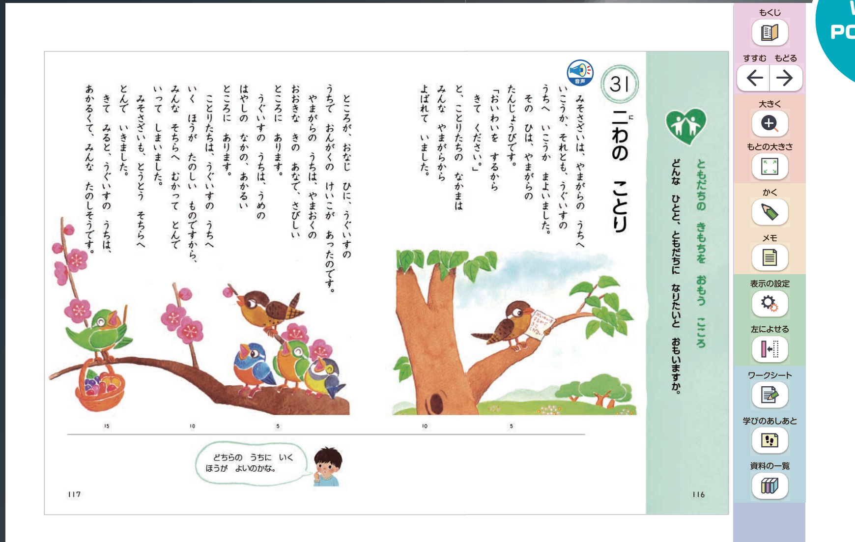
※画面はイメージです