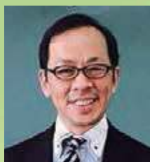
ひまわり先生 活用レポート