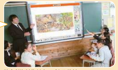
社会科資料集対応デジタル教材 →「デジしゃか」の例