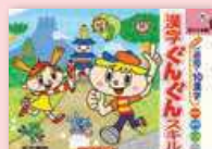
漢字ぐんぐんスキル