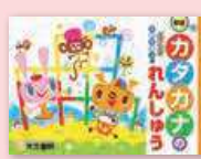
カタカナのれんしゅう