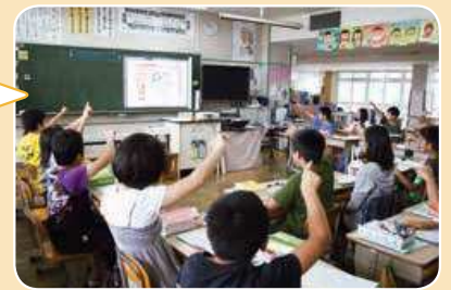
漢字・国語ドリル対応デジタル教材 →「デジ漢」の例

社会科資料集に掲載されている資料を拡大表示できます。クラス全体で読み取り、理解を深められます。