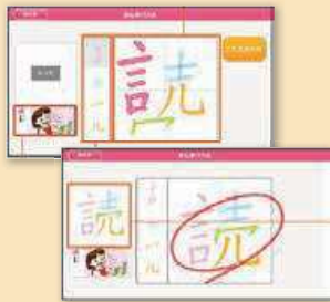
漢字・国語ドリル対応デジタル教材 →「デジ漢」の例