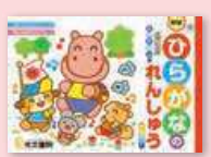
ひらがなのれんしゅう