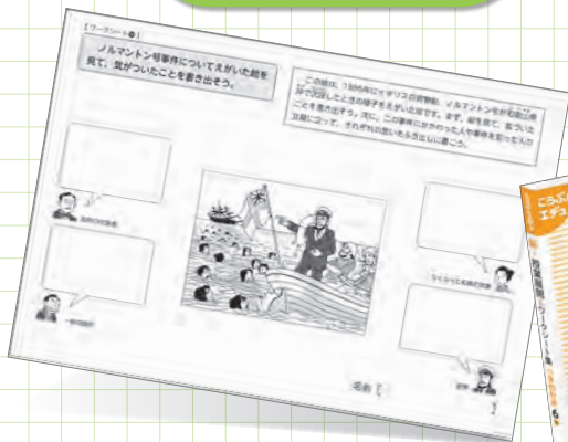
本書別冊のワークシート

本書のワークシートを活用することで、教師が一方的に学習問題を提示するのではなく、子ども一人ひとりが疑問をもち、それを学級全体で共有しあいながら追究して、問題を解決していこうとする姿が見られました。